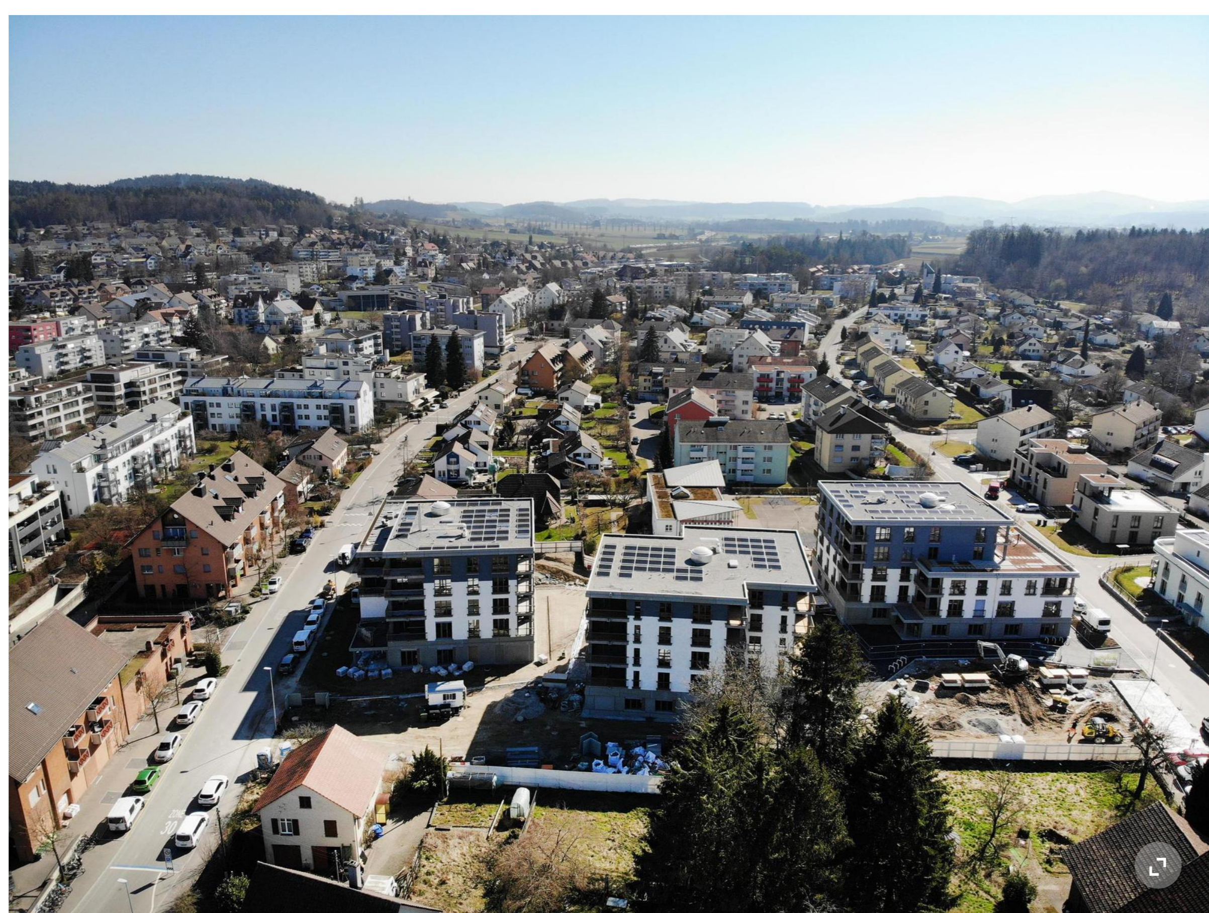
Die Überbauung Schneckenwiese in Seuzach, wie sie sich Ende März aus der Luft präsentierte. Die Kinderbetreuung befindet sich im Neubau rechts, der an die Reutlingerstrasse grenzt.

Die Überbauung Schneckenwiese steht im Zentrum von Seuzach. Seit diesem Frühling erwacht die dreiteilige Siedlung der Gaiwo-Genossenschaft, die von Hinder Kalberer Architekten gestaltet wurde, zum Leben.